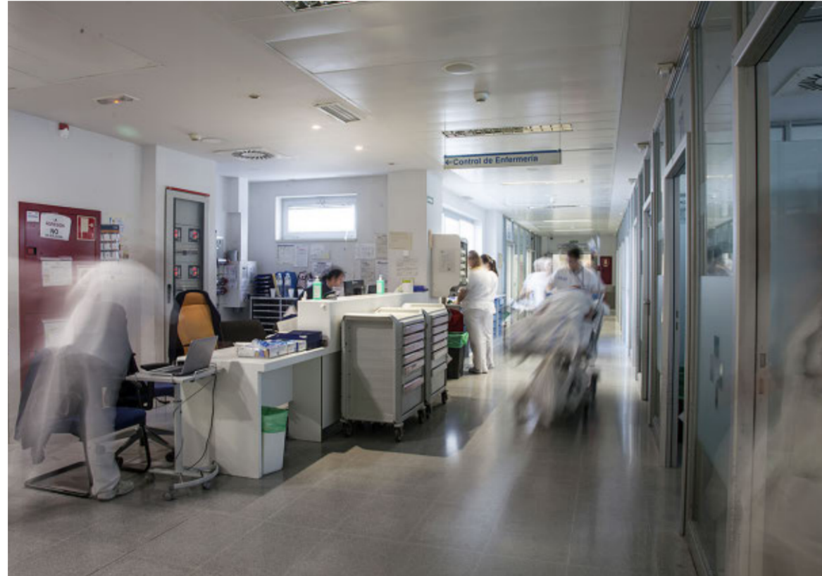
Los servicios de Urgencias hospitalarias del San Pedro reciben más de cien mil consultas al año.

Los datos son los que son. No engañan. Y si Urgencias hospitalarias «atiende 105.000 consultas al año», algo más de 40.000 podrían solucionarse en el médico de atención primaria o en los centros de salud. Marco afirma que «puede que haya desconocimiento», pero también comenta que «los pacientes piensan que les vamos a atender mejor porque consideran que vienen a las Urgencias del Hospital San Pedro». No es así. «Las urgencias hospitalarias son para hechos concretos y puntuales, no es para venir día sí y día también. Lo aconsejable es acudir al médico de atención primaria», el cual además posee un valor añadido: «El médico