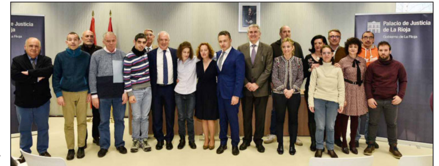
Acto de presentación del proyecto de adaptación de sentencias a lectura fácil.