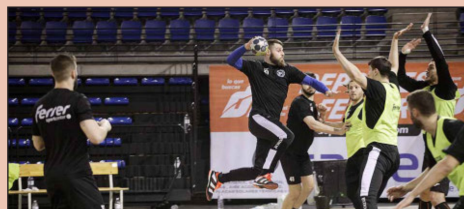
El equipo BM Logroño La Rioja, en un entrenamiento.

Estos equipos jugarán el primer partido en los cuartos de final. En los cuartos de final juegan 8 equipos, uno contra otro, en 4 partidos. Para ver quién llega a la semifinal y a la final.